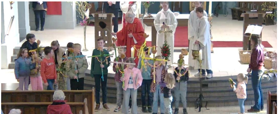
Palmpasenviering, de zegening van kinderen en de palmpas stokken