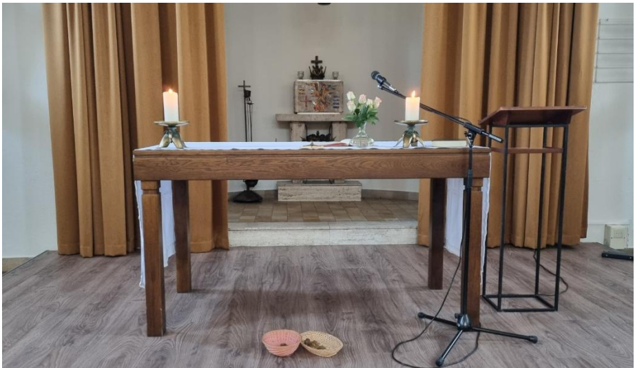
Kapel Gaza, na de viering op de 2 e vrijdag van de maand

U bent van harte welkom om daarbij aan te sluiten.