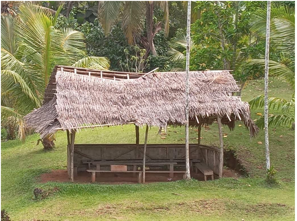
Het huidige 'haus win'...

Ook het 'haus win' (een gedeeltelijk open maar wel overdekte ruimte waar de kinderen beschut tegen de felle zon hun lunch gebruiken) was hoognodig aan vervanging toe. De ruimte is veel te klein voor het in de loop der jaren toegenomen aantal leerlingen en de dakbedekking (gevlochten bladeren van de sagopalm) is niet langer regenbestendig en vertoont hier en daar zelfs forse gaten.