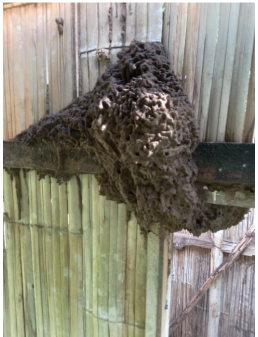
Een nest van witte mieren

En op de app van Het Parool was te lezen dat het met het onderhoud van bruggen, viaducten, tunnels, spoordijken en wegen in Nederland slecht gesteld is. Tja, alles wat we bouwen vraagt nu eenmaal het nodige onderhoud en soms is sloop en nieuwbouw het enige alternatief. Zo ook hier in Banlo. Nee, er is gelukkig niets mis met de beide fraaie, riante klaslokalen. De enige jaren geleden gebouwde toiletgelegenheid voor de kinderen stond echter dankzij de bedrijvigheid van de witte mieren op instorten.