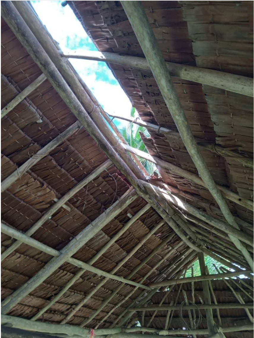
Het open dak van het huidige 'haus win'...