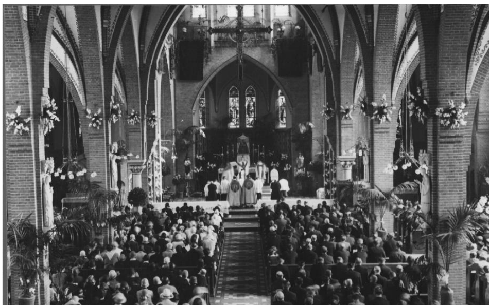
Foto: De ingebruikneming van de nieuwe St.-Ludgeruskerk.

Meer info over deze kerk bij de Utrechtse erfgoedcollecties