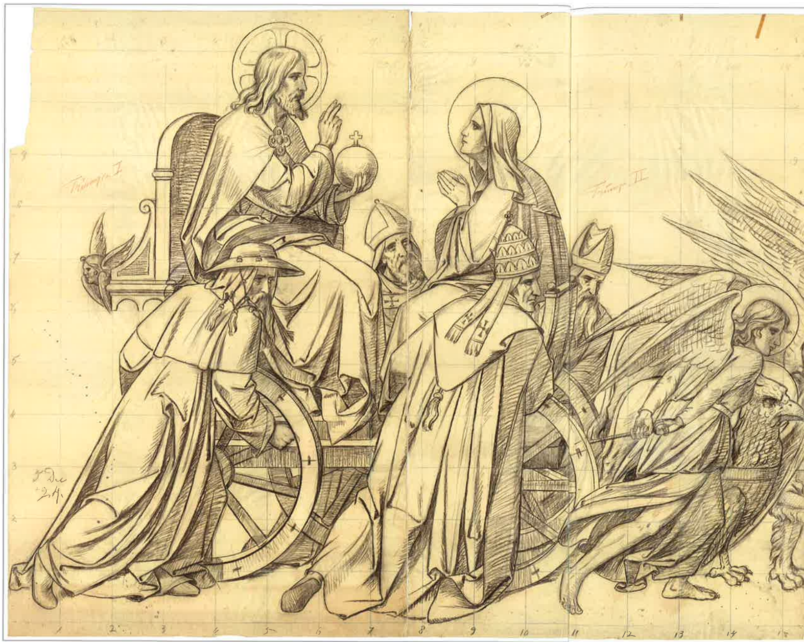
Carton van de zegewagen met Christus daarop die wordt getrokken door de vier evangelisten, voorgesteld met hun symbolen, waarvan hier slechts twee te zien: de havik (symbool van Johannes) en de gevleugelde mens (symbool van Mattheus). Zij worden geholpen door de vier kerkleraren, die de raderen van de wielen voortduwen: Sint Gregorius, Hieronymus, Ambrosius en Augustinus. Op de wagen Maria, die heeft meegeleden met haar zoon en hier nu nadrukkelijk deelt in zijn vreugde.

viel in het niet bij de verbeelding van de Triomf van Christus. 4