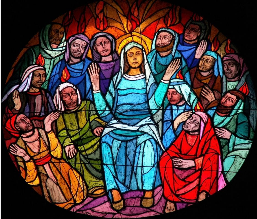
Maria en de leerlingen, kerkje van Rivotorto