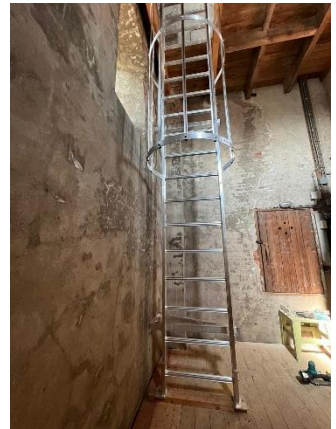
2 e verdieping